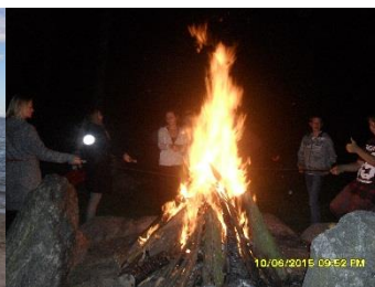
Wyjazd na ognisko