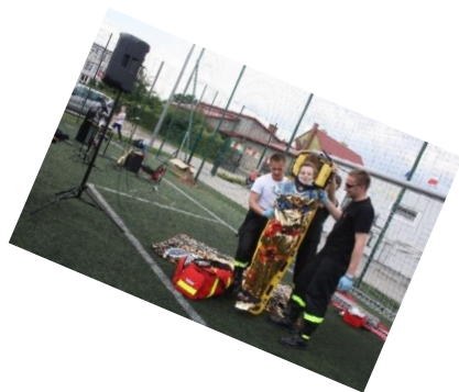
Pokaz udzielania pierwszej pomocy przez Straż Pożarną.