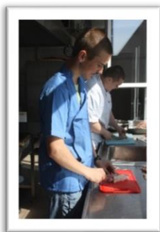
*KUCHARZ MAŁEJ GASTRONOMII