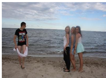
Wyjazd nad morze

*MOŻLIWOŚĆ KORZYSTANIA Z DARMOWYCH ATRAKCYJNYCH WYJAZDÓW I WYCIECZEK