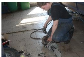
* MECHANIK POJAZDÓW SAMOCHODOWYCH